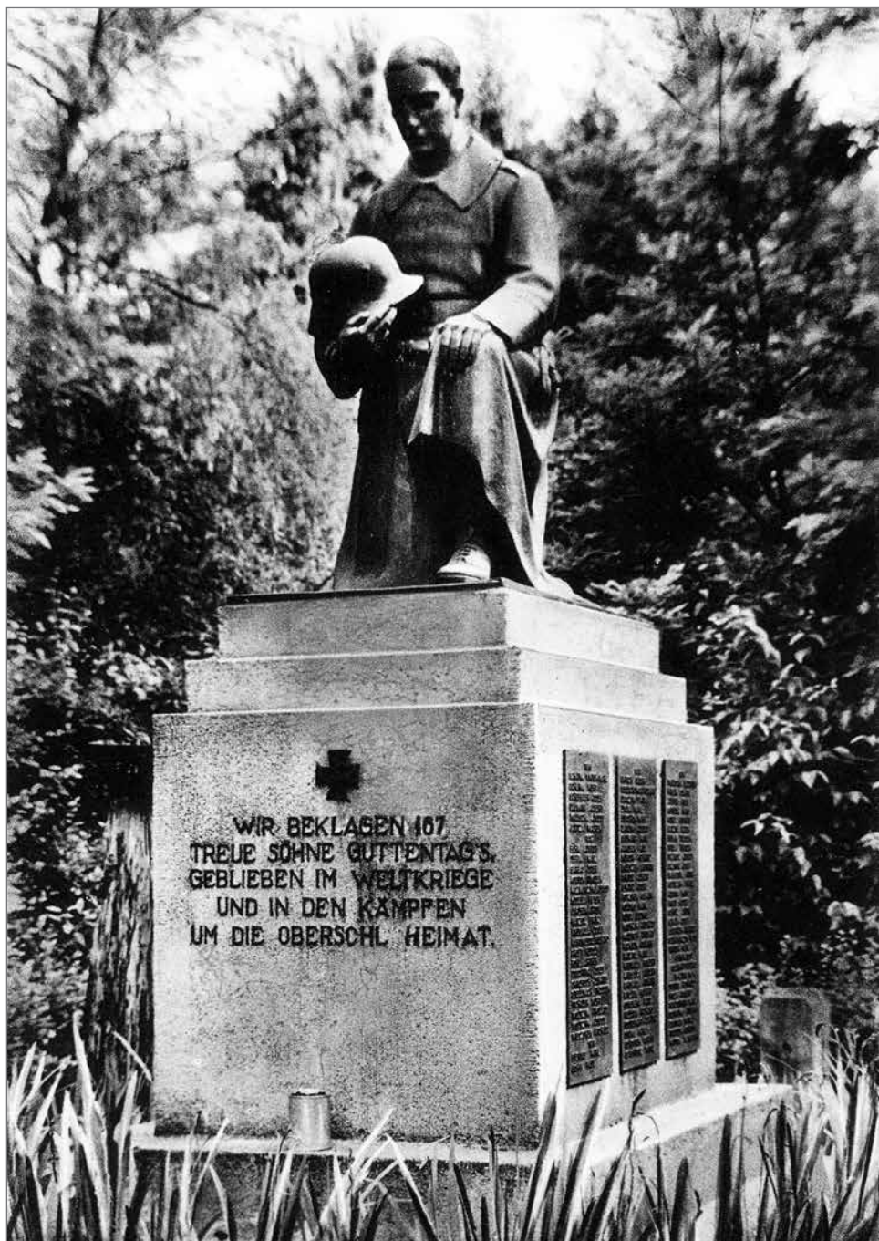
Kłęczący żołnierz symbolem powiatu dobrodzieńskiego [Kreis Guttentag]