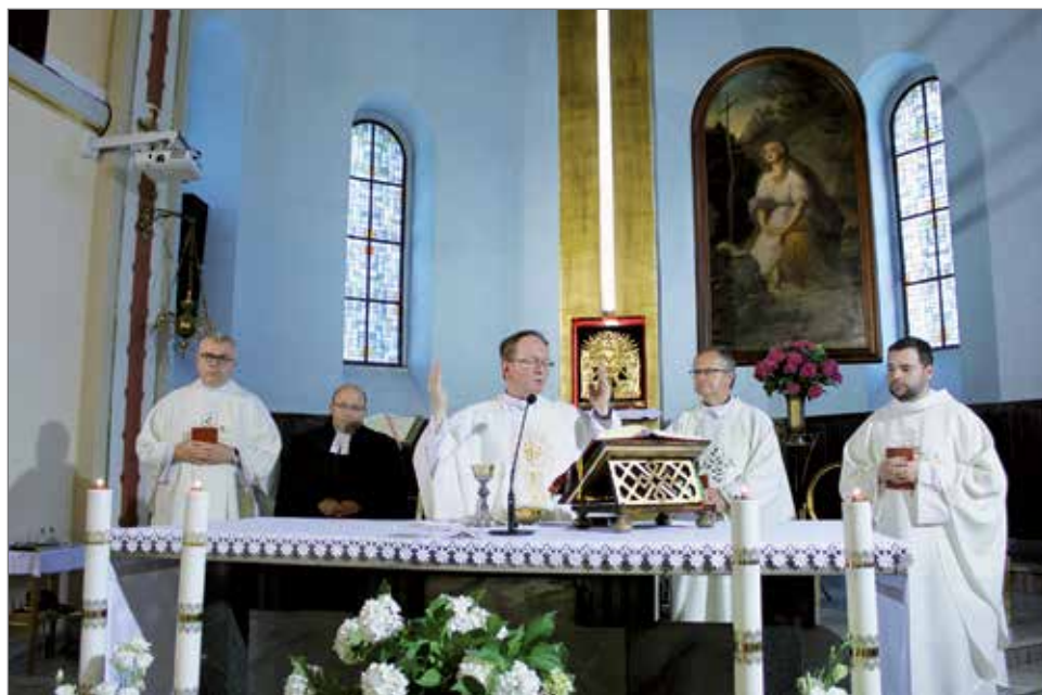
Uroczysta Msza Święta w kościele parafialnym w intencji poległych i zaginionych dobrodziejian