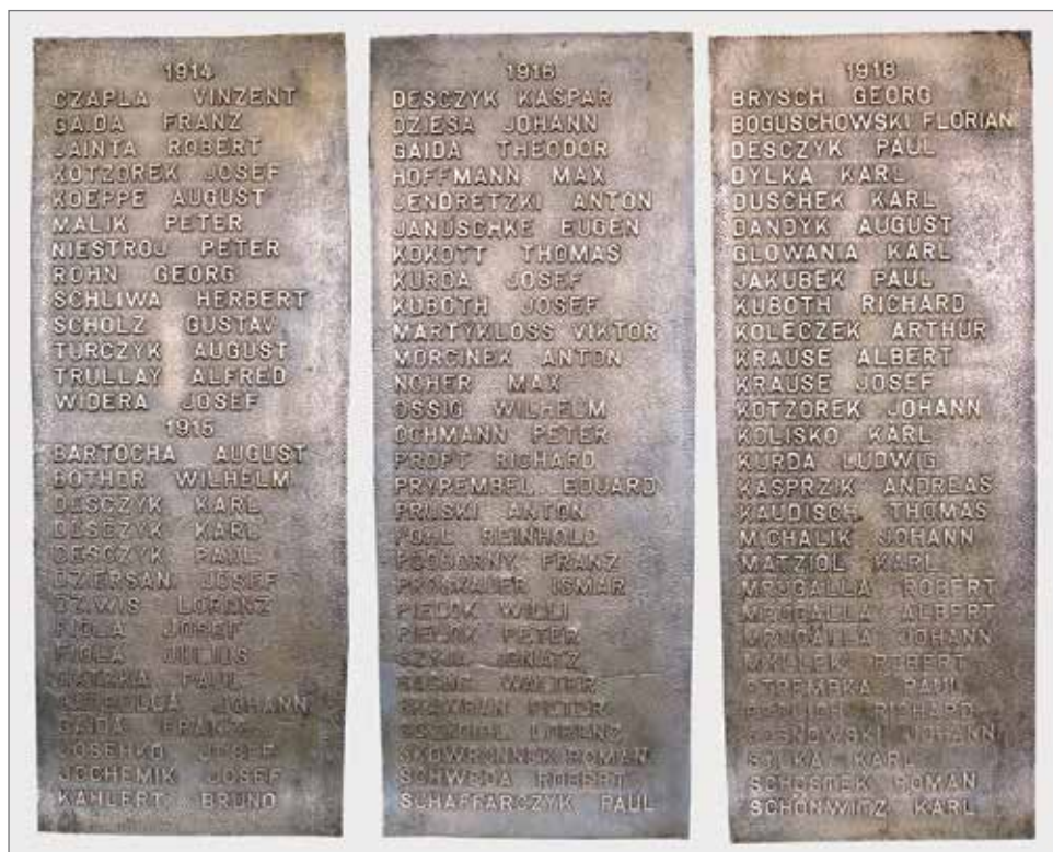
Tablice pomnikowe z 86 nazwiskami poległych dobrodzienian, przypadkowo odnalezione w 2007 roku

22 listopada 2016 roku w posiedzeniu Komisji Oświaty, Kultury, Kultury Fizycznej, Zdrowia, Opieki Społecznej i Promocji Gminy wziął udział prezes Międzygminnego Towarzystwa Regionalnego Dobrodzień-Zębowice i przedstawił temat „Miejsca warte upamiętnienia”, na podstawie przygotowanej prezentacji, w kontekście pisma skiero-