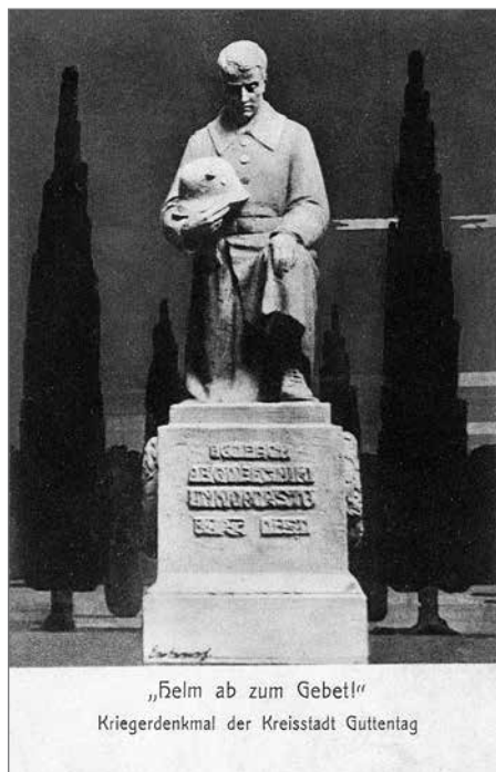
Projekt pomnika nieznanego autora

„Pomnik Żołnierza” został uroczyście odsłonięty 1 września 1929 roku w obecności mieszkańców miasta i wiosek przy pięknej, słonecznej pogodzie. W uroczystościach wziął udział w mundurze generalskim ostatni król Saksonii, który odebrał paradę wraz z synem Georgiem.