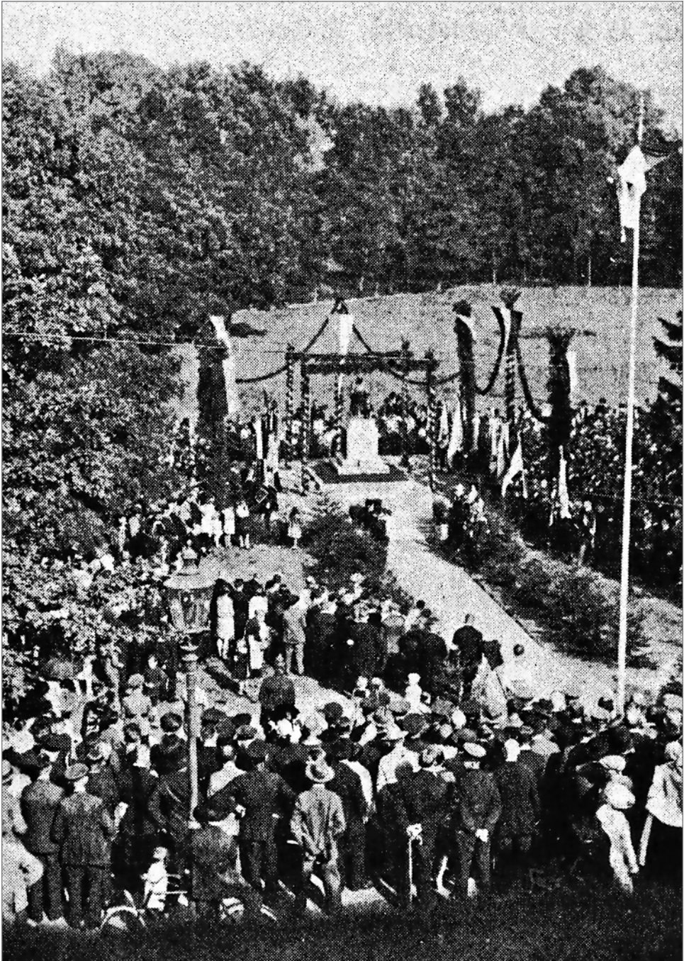
Uroczystość odsłonięcia Pomnika Żołnierza w parku dworskim 1 IX 1929 roku