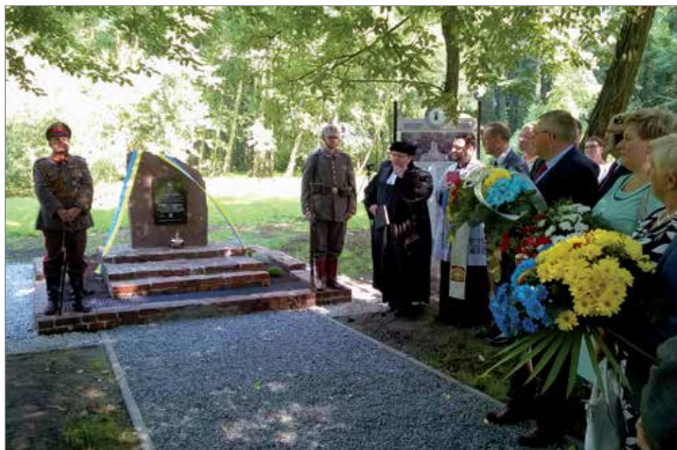
Uroczystość odsłonięcia pamiątkowej tablicy na ruinie pomnika kłęczącego żołnierza z 1929 roku