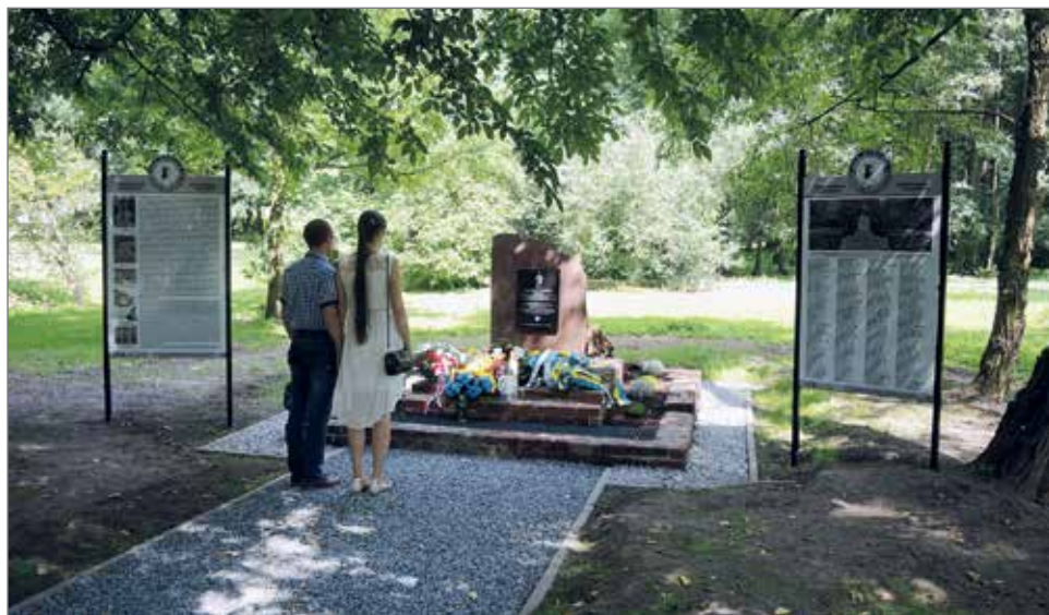
Forma upamiętnienia poległych mieszkańców z okazji obchodów 100. rocznicy zakończenia Wielkiej Wojny

Źródła: Goszyk E., Przeżyć I wojnę światową , Echo Dobrodzienia, nr 66/2007, s.10 • Guttentager Stadtblatt 1914–1918 • http://des.genealogy.net/eingabe-verlustlisten/search (2018) • https://pl.wikipedia.org • Loben-Guttentager Kreisblatt 1997, 1998 • Mrozek P., Dobrodzień na pocztówce i fotografii 1884–1944 , Dobrodzień 2014 • Oberschlesien im Bild 1933 • Oberschlesische Volksstimme 1929 • Oberschlesischen Wanderer 1929 • Tablice pomnikowe przechowywane w Muzeum Regionalnym w Dobrodzieniu • Zapiski kronikarskie autora artykułu • Zbiory Międzygminnego Towarzystwa Regionalnego Dobrodzień–Zębówice