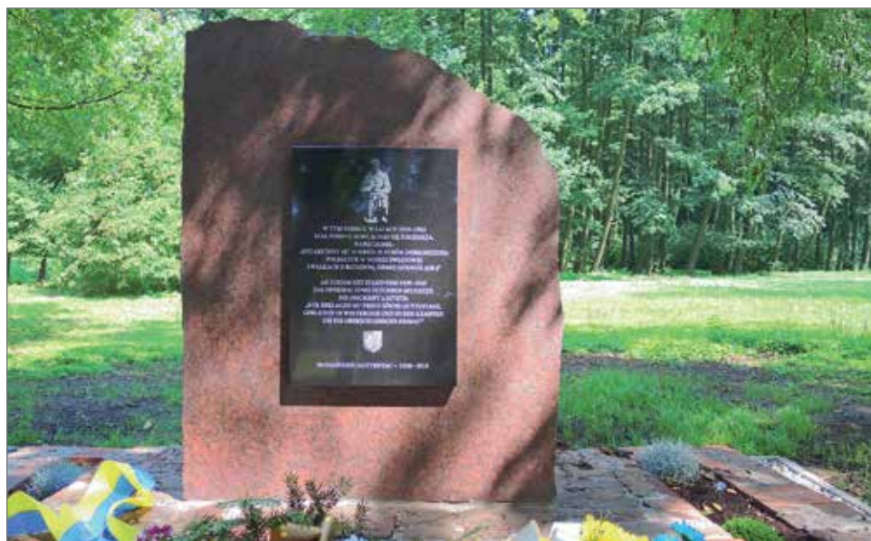
Tablica z inskrypcją: W tym miejscu w latach 1929–1945 stał pomnik modlącego się żołnierza. Napis głosił . . .