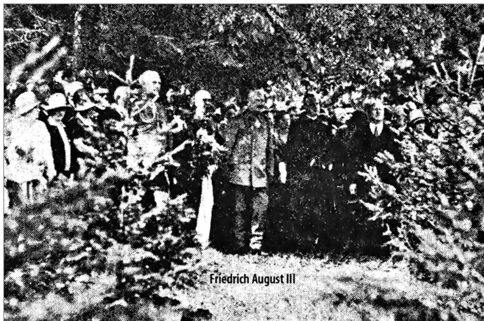
Friedrich August III z osobami towarzyszącymi podczas uroczystości odsłonięcia Pomnika Żołnierza

Źródło: Oberschlesische Volksstimme 1929